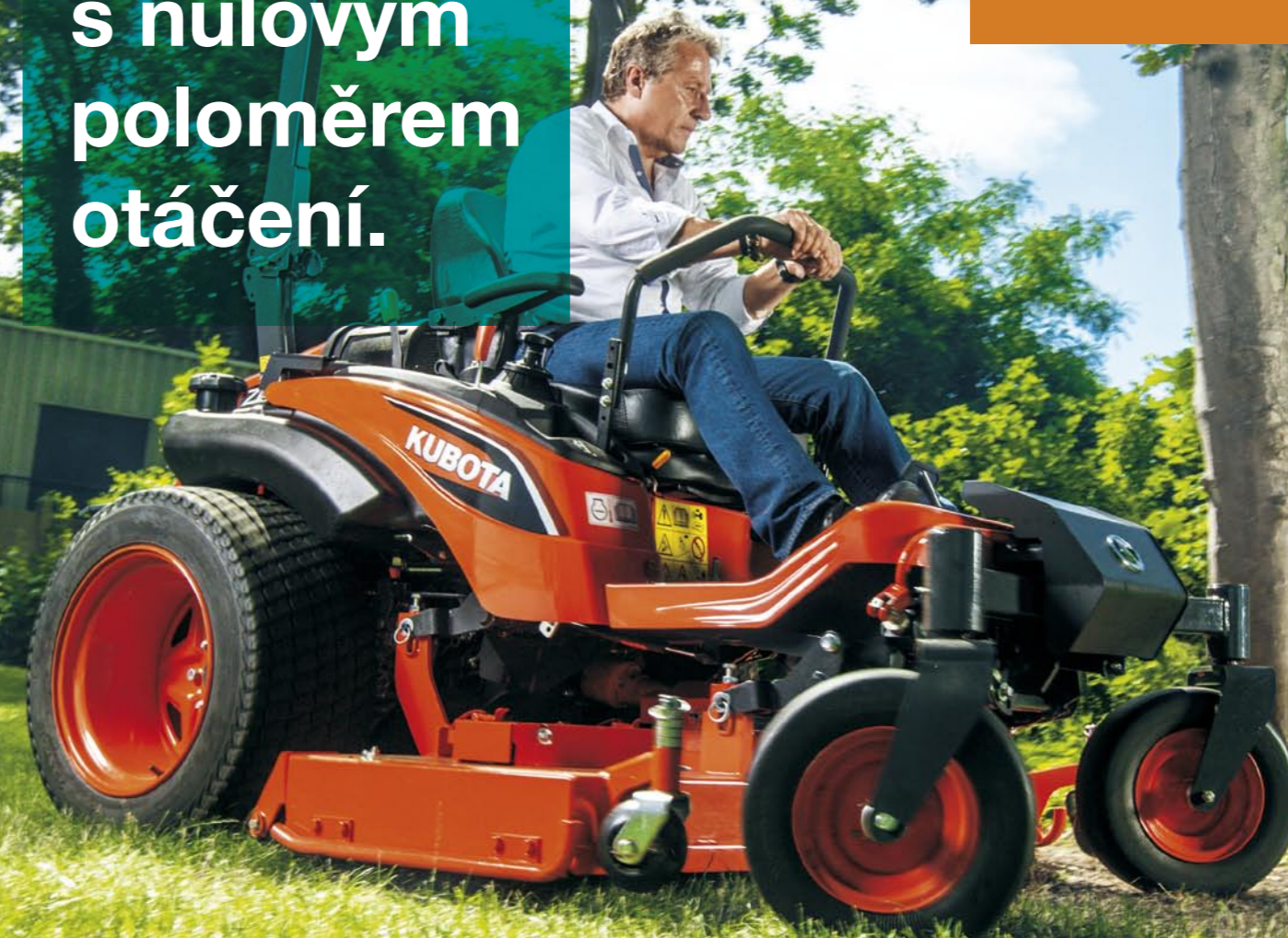
Sečení se zadním výhozem